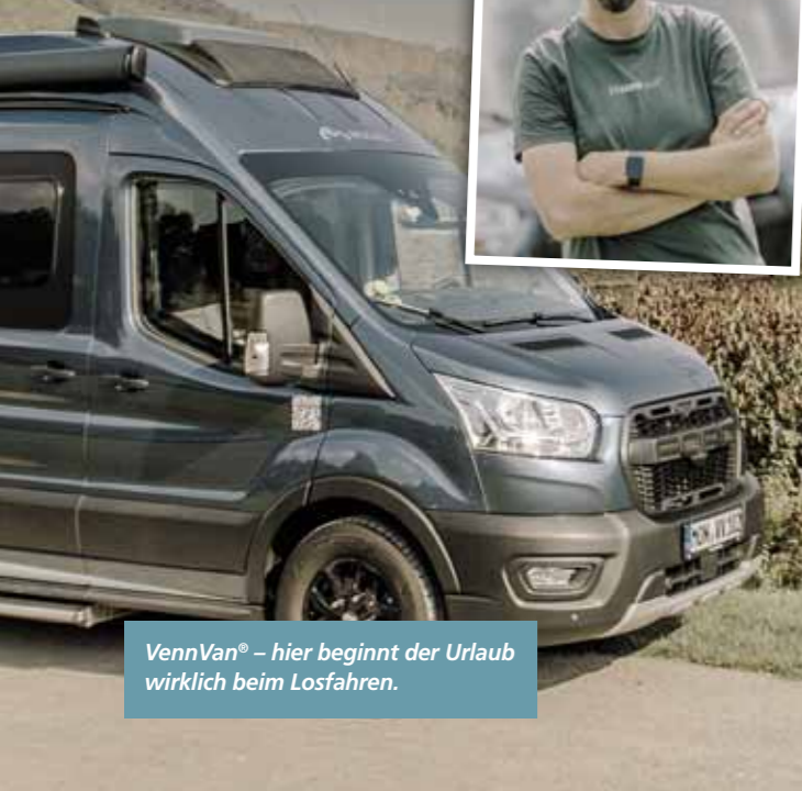
VennVan® – hier beginnt der Urlaub wirklich beim Losfahren.

In Dedenborn betreibt Markus Wimmer die Campervan-Vermietung VennVan®, und setzt dabei auf einen Standard, der im Vermietungsmarkt seinesgleichen sucht.