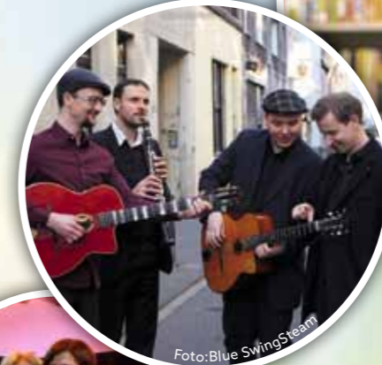
Foto: Blue Swing Steam

Im Rahmen der Städtereionalen Kulturtage präsentieren „Blue Swing- Steam“ Swing der 30er und 40er Jahre mit Klassikern und weniger bekannten Perlen der Swing-Ära. 19 Uhr im Dorfgemeinschaftshaus Kesternich, Tickets online erhältlich.