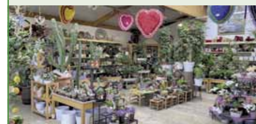
Moderne Floristik, Zimmerpflanzen und mehr...