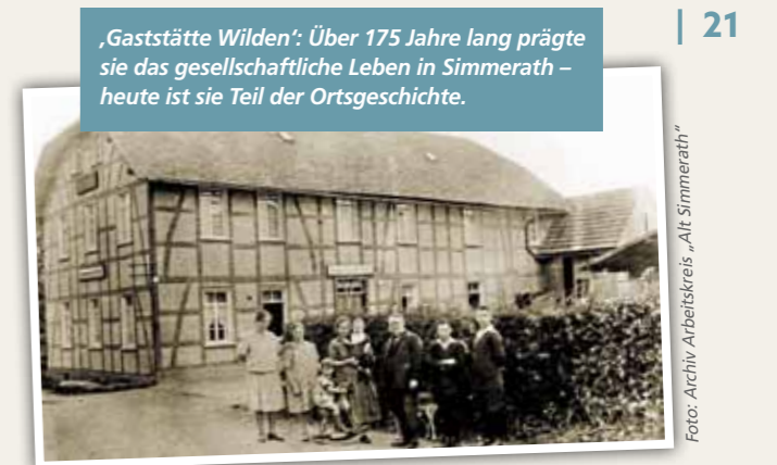
‚Gaststätte Wilden‘: Über 175 Jahre lang prägte sie das gesellschaftliche Leben in Simmerath – heute ist sie Teil der Ortsgeschichte.