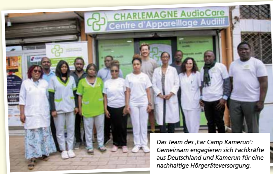
Das Team des „Ear Camp Kamerun“: Gemeinsam engagieren sich Fachkräfte aus Deutschland und Kamerun für eine nachhaltige Hörgeräteversorgung.