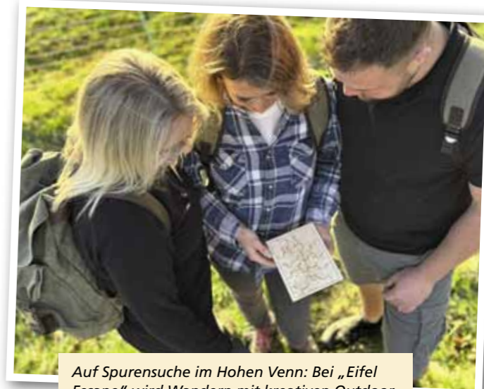
Auf Spurensuche im Hohen Venn: Bei „Eifel Escape“ wird Wandern mit kreativen Outdoor-Rätseln zu einem besonderen Erlebnis.

In idyllischer Umgebung – vorbei an Bächen, Felsen und durch Wälder – entfalten sich kleine Denkaufgaben, die