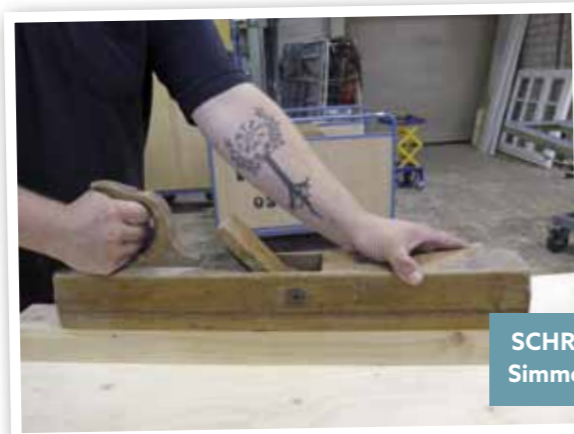
SCHREINEREI WILDEN Simmerath-Rollesbroich

Es dauert in der Regel drei Jahre, bis man Fenster, Türen und Möbel schreinern kann.