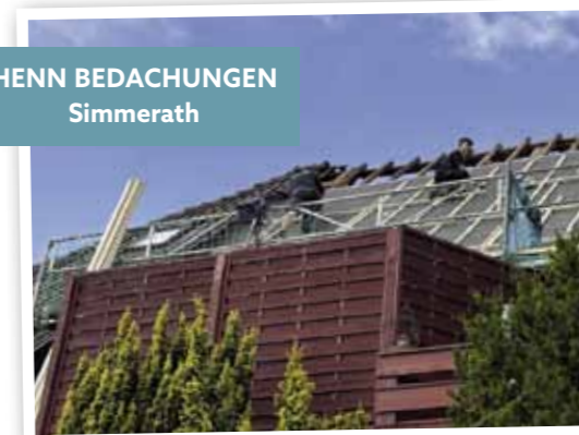
HENN BEDACHUNGEN Simmerath

Er beschreibt seinen Job als vielseitig, freut sich darüber, dass man meistens draußen arbeitet. „Auf den Baustellen lernt man viel, Meister und Gesellen erklären, was zu tun ist.“ Durch die Berufsschule in Eschweiler und die Lehrgänge im Simmerather BGZ wird ihm noch mehr theoretisches und praktisches Fachwissen vermittelt. Die Anforderungen können sehr unterschiedlich sein; nach dreijähriger Lehrzeit muss er wissen, wie man ein Steildach oder ein Flachdach deckt – und vieles mehr.