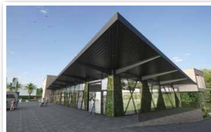
Entwurf des neuen Büro- und Lagergebäudes im Gewerbegebiet Simmerath-Rollesbroich: Drei Hallen, moderne Glasfassade und viel Platz für die Zukunft.

Cargo, ein Import-/Export-Unternehmen. Damit unterstützt sie den Aufbau einer modernen Supermarktkette in Kuba und Lateinamerika – als Beitrag zur lokalen Versorgung und als Investition in die Zukunft.