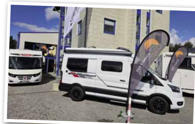
Mit RexCamper bietet das Simmerather Unternehmen seit 2020 Wohnmobile für flexible und individuelle Reisen an.

Neben Reisen und Vermietung hat sie ein drittes Standbein: MKL