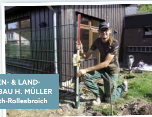
GARTEN- & LANDSCHAFTSBAU H. MÜLLER Simmerath-Rollesbroich