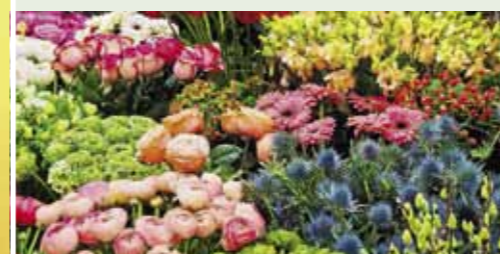
Moderne Floristik, Zimmerpflanzen und mehr...