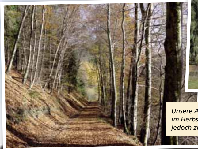
Unsere Aufnahmen entstanden im Herbst; der Weg lohnt sich jedoch zu jeder Jahreszeit.

Rechts unterhalb des Weges befindet sich der Jugendzeltplatz Tiefenbachtal, in diesem Bereich wurde bis vor hundert Jahren Schiefer unterirdisch abgebaut, das Unter-