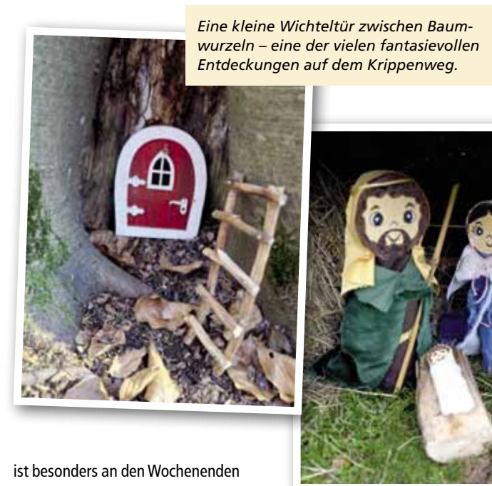
Eine kleine Wichteltür zwischen Baumwurzeln – eine der vielen fantasievollen Entdeckungen auf dem Krippenweg.