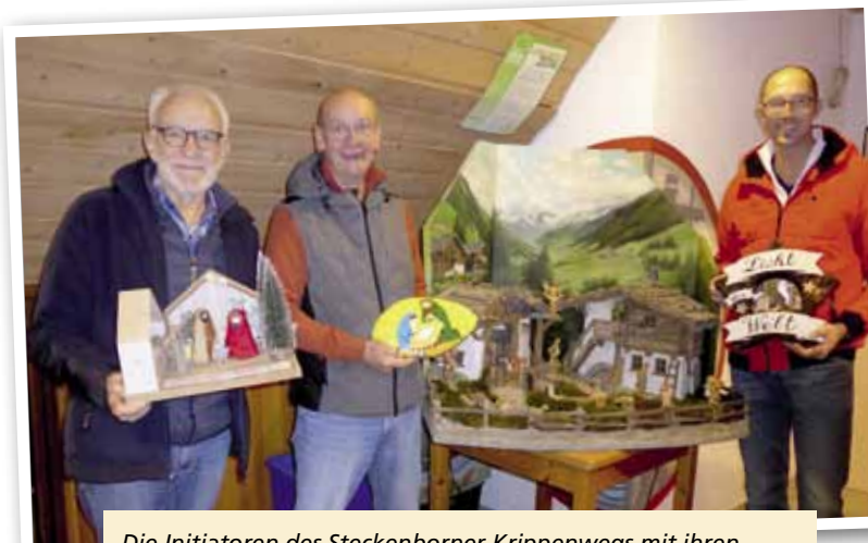
Die Initiatoren des Steckenborner Krippenwegs mit ihren liebevoll gestalteten Krippen. Diese und von Bewohnern und Spendern aus der Region zur Verfügung gestellte Krippen säumen den 3,5 Kilometer langen Steckenborner Krippenweg.

Nun ist der Steckenborner Krippenweg in aller Munde. Im Radio und im Fernsehen wurde darauf hingewiesen. Der Besucherandrang