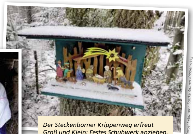
Der Steckenborner Krippenweg erfreut Groß und Klein: Festes Schuhwerk anziehen, Rucksack mit warmen Getränken und Leckereien packen – und los geht's!