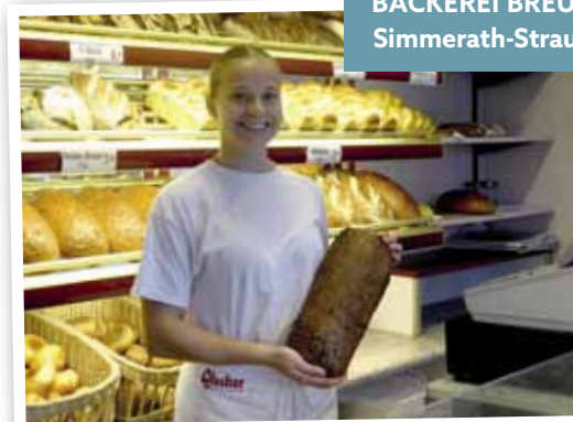
BÄCKEREI BREUER Simmerath-Strauch

Die Vorweihnachtszeit bietet natürlich Herausforderungen: In der Weihnachtsbäckerei kann es stressig zugehen – aber: „Es macht auch Spaß!“