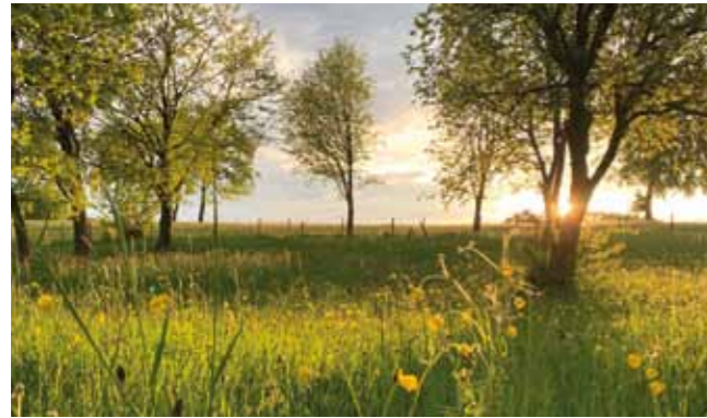
Mai © Sabrina Pfeiffer