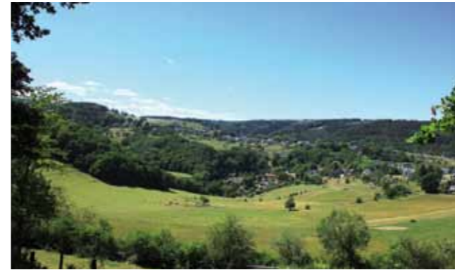
Juli © Theo Broek