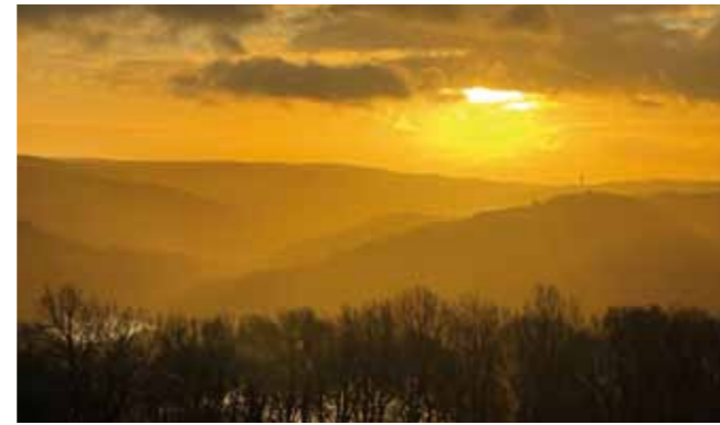
Februar