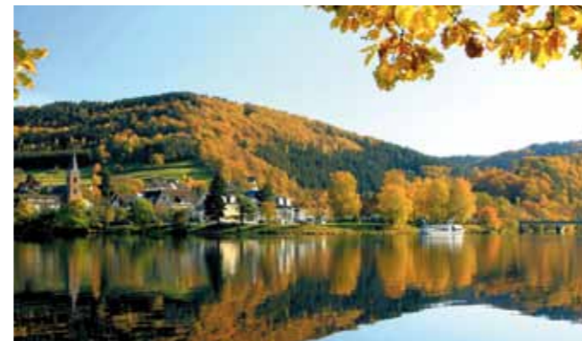
Oktober © Michael Usadel